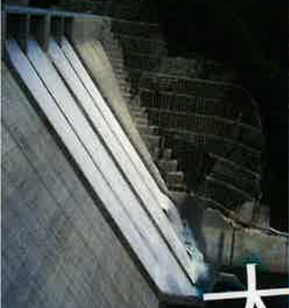
巨大な湯西川ダム